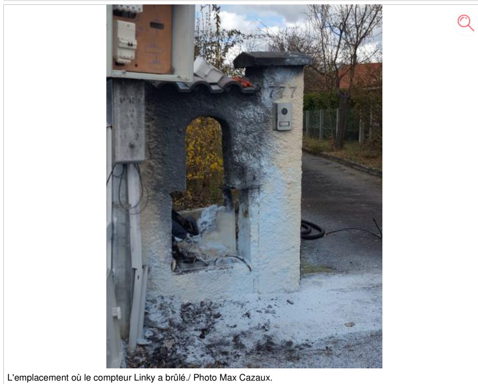
L'emplacement où le compteur Linky a brûlé.

C'est une désagréable surprise qu'a eu un Saint-Gaudinois en rentrant chez lui. En effet, son compteur Linky a brûlé et occasionné de nombreux dégâts, heureusement pour lui, à l'extérieur de sa maison.