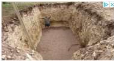
L'homme creuse un trou massif

Le 13 octobre, cet habitant de Châlette-sur-Loing racontait s'être levé "pour aller actionner le commutateur", à la suite d'une interruption de courant : "C'est alors que j'ai entendu des bruits pétaradants et que le compteur électrique Linky, installé depuis à peine une quinzaine de jours, a explosé et pris feu."