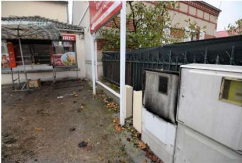
Le compteur électrique en question, à Châlette-sur-Loing (quartier de Vesines).