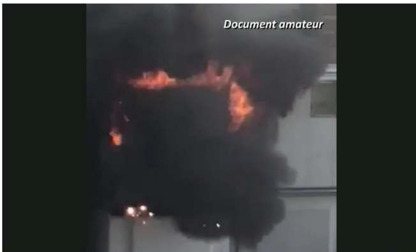
Un boîtier électrique équipé d'un compteur Linky en flammes à Châlette-sur-Loing